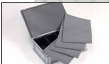
Placas de espuma disponíveis em stock para fixar os elementos interiores e as divisórias.