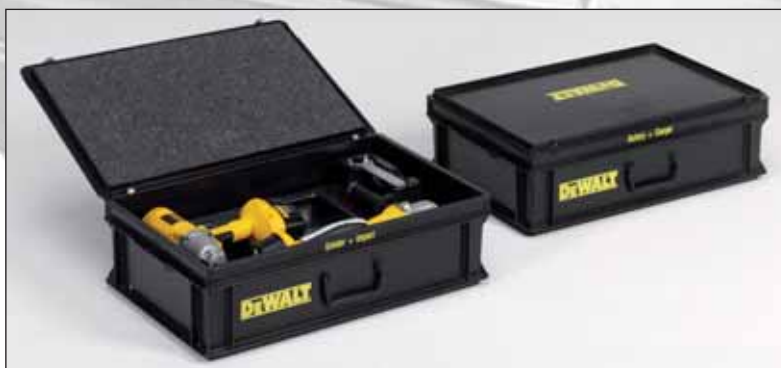
Malas, completas com interiores moldados a vácuo para ferramentas de qualidade (cliente DeWalt).