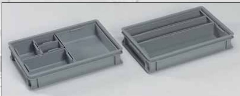
Elementos interiores para caixas e malas RAKO com medida base 600x400 mm.