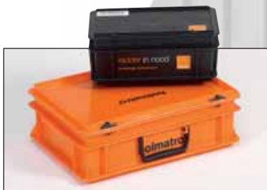
Exemplo de cor e impressão feita nas malas.

As malas RAKO são bastante fortes e perfeitamente empilháveis. Podemos fornecê-las com elementos interiores e protecções.