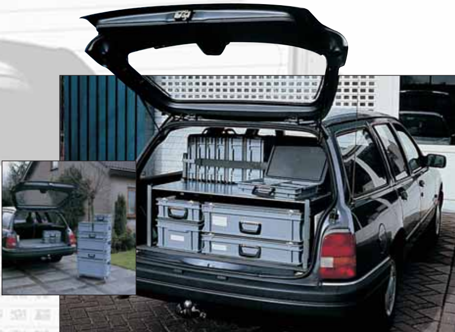
Caixas RAKO com peças numa viatura de serviço. Perfeitamente arrumadas e fáceis de retirar para o fim-de-semana.