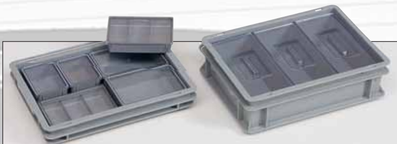
Elementos interiores para caixas e malas RAKO com medida base 400x300 mm.

Assim que empilhar as caixas, deixa de ver o seu conteúdo. Para tal temos uma vasta gama de suportes de etiquetas para poder seguir o conteúdo.