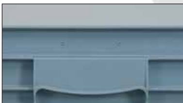
Pega fechada 800 x 600.

nº art.: 3 - 203 - 0 pega fechada nº art.: 3 - 203 - 0 R material reciclado