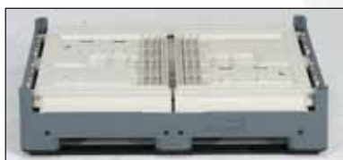
Dobrada, perfeitamente lisa e empilhável. Economia de espaço de 805 mm em altura 3:1, de 978 mm em altura 7:3.