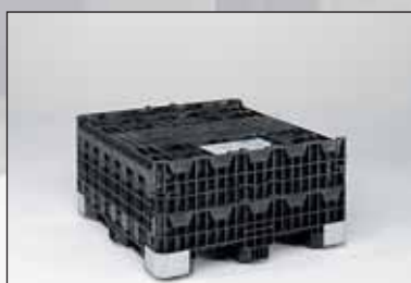
Fecha-se num virar de mão. Não é preciso ter em atenção a ordem. As pegas estão colocadas a uma altura ergonómica.

Caixas-palete dobráveis americanas clássicas, design sóbrio, extremamente forte. Paredes e nervuras de reforço espessas graças a uma produção em "structural foam" PEAD. Dobradiças em aço, reforço de patins em aço, protecções em metal nos cantos contra as colisões. Já fornecemos milhares de exemplares deste produto, p. ex. para o sector da distribuição de envios não dirigidos ou para a reciclagem de peças de carcaças de viaturas.