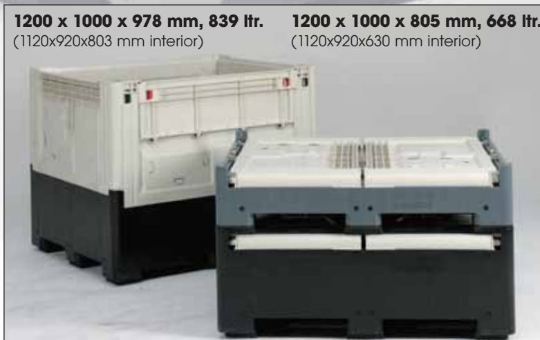
Smartbox compatíveis com Isopaletes.