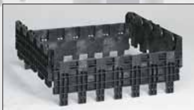
Peça de elevação 254 mm. É fixada entre o fundo da paleta e as paredes com dobradiças. Não é dobrável.