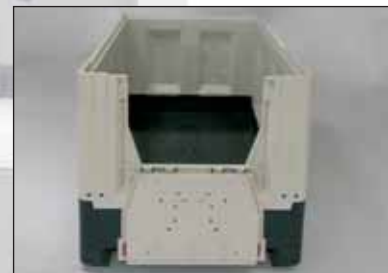
Abertura de inserção num dos lados compridos para 800 e 1000 mm versão longa, altura 375 mm.

As Smartbox, que podem ser carregadas com cargas pesadas, são perfeitamente indicadas para o armazenamento e o transporte de peças a granel na indústria de subcontratação. Podem eventualmente ser utilizados intercalares que voltam com a caixa vazia. Estão previstos para as alturas industriais.