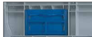
Porta-etiqueta, um do lado curto e outro do lado comprido, formato A5, em conformidade com as indicações Odette.