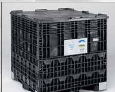
Tampa amovível em "structural foam".