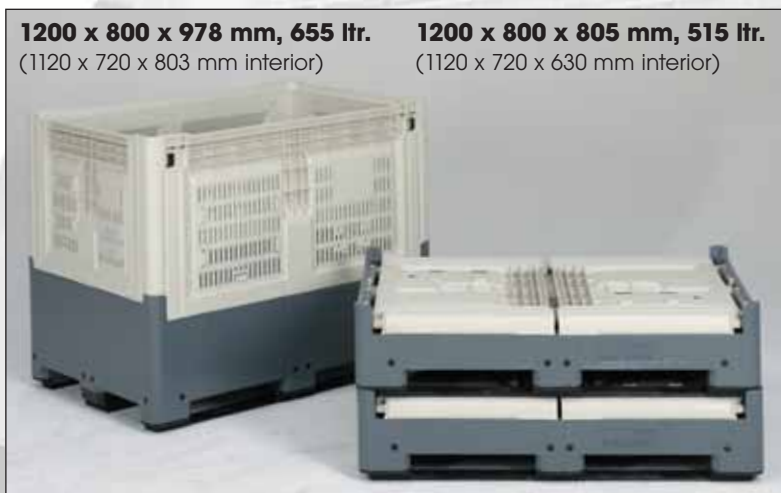
Smartbox compatíveis com Europaletes.