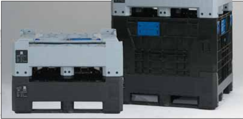
Caixas-palete dobráveis para a indústria automóvel, versão original e "light" (cinza escuro). Economia de volume: 7 caixas dobradas têm a mesma altura do que 3 empilhadas.

800 x 600 x 770 mm, 261 ltr. (744 x 544 x 645 mm interior)