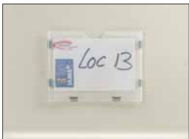
Porta-etiquetas inquebráveis semi-transparentes.