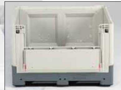
Lateral amovível em um ou nos dois lados compridos; altura alternativa 280 ou 370 mm.

Fornecemos para a gama Smartbox exactamente os mesmos serviços e acessórios da caixa-paleta em uma peça. Imprimimos o seu nome, eventualmente reparamo-las e guardamos peças em stock. Além disso soldamos duas peças numa caixa-paleta longa (ver também pag. L92), p. ex. para os para-choques ou para as lâmpadas fluorescentes.