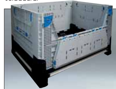
Também disponível com maior comprimento e reforçada.