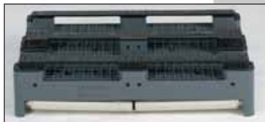
Apresentação do fundo: 2 ou 3 patins, perfurados ou fechados.

Carregáveis por períodos longos até 1.000 kg por caixa e 5.000 kg em pilha (testada por um curto período de tempo até 10.000 kg). Altura adaptada a um carregamento optimal dos camiões standar ou às normas da indústria