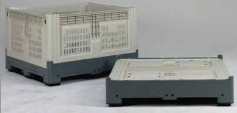
Smartbox de grande volume.

1200 x 1200 x 978 mm, 1041 ltr. (1120 x 1120 x 803 mm interior) 1200 x 1200 x 805 mm, 821 ltr. (1120 x 1120 x 630 mm interior)