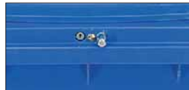
fechadura automática, abre pela colocação no camião de recolha, abertura também possível com chave (principal)

Os modelos apresentados em seguida são muitas vezes dotados de fechaduras: