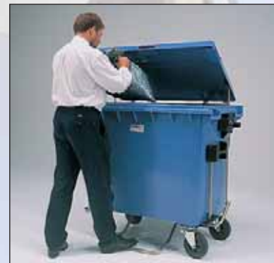
pedal para contentor de 4 rodas