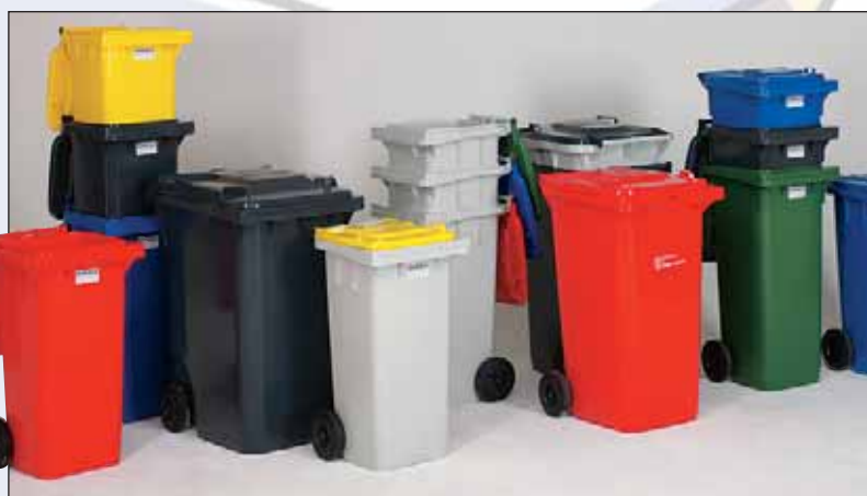
todos os tamanhos e cores standard em stock

podemos personalizar os corpos com serigrafia ou estampagem a quente