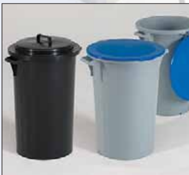
os contentores clássicos fecham hermeticamente

Os modelos apresentados em seguida são muitas vezes dotados de fechaduras: