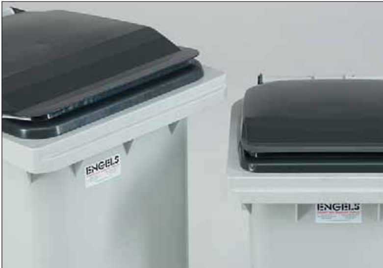
as tampas standard vêm com aba (acima) ou com 2 pegas

Em todos os nossos contentores montamos as seguintes fechaduras: