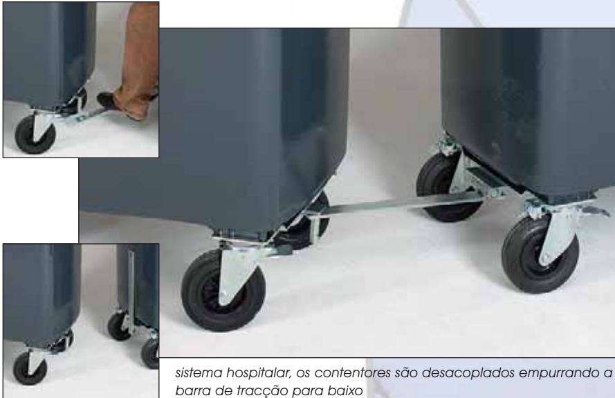
sistema hospitalar, os contentores são desacoplados empurrando a barra de tracção para baixo

Os nossos contentores de lixo (tanto os de 2 rodas como os de 4 rodas) podem ser dotados de sistemas de acoplamento para que possam ser transportados em comboio. Os cálculos precisos fazem com que seja tão fácil deslocar seis contentores como um único.