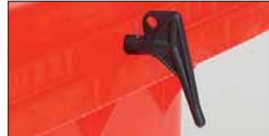
fechadura triangular, modelo standard ou aberto-fechado