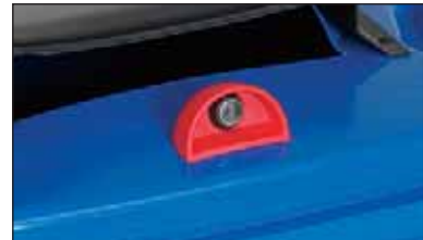
fechadura gravítica, abre (somente) pelo basculamento do contentor, para chave comum ou chave triangular