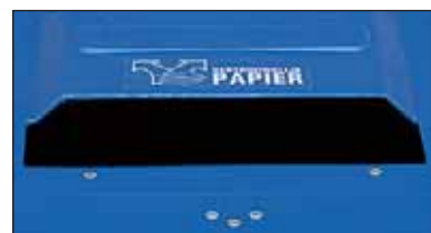
ranhura para papéis, protecção contra remoção opcional