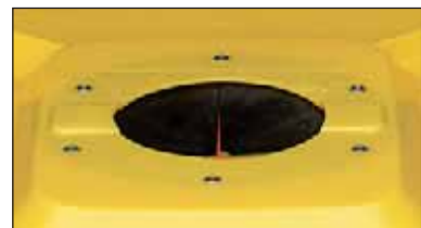
roseta para vidro, montamos em todos os modelos