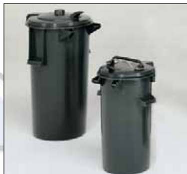
modelo pesado, tampas fortes com dobradiças