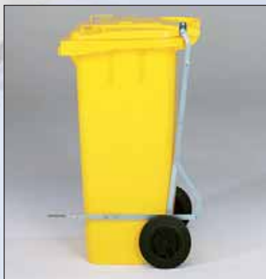
pedal abre-tampas para contentores de 140/240 litros