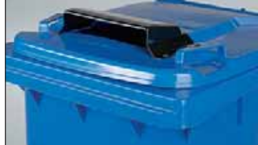
art.nº.: MGB 35 com tampa de aba art.nº.: MGB-papel com tampa de aba

protecção contra a chuva/ ranhura para papéis