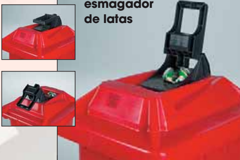
art.nº.: MGB BLIKP em contentor de 240 l

protecção contra a chuva/ ranhura para papéis