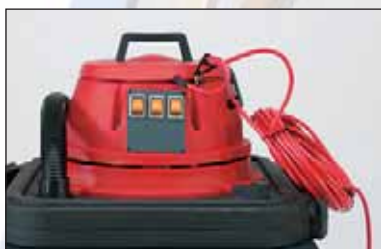
possibilidade de aplicação de 1, 2 ou 3 motores independentes por contentor

Unidade aspiradora disponível com 1, 2 ou 3 motores em função da capacidade de aspiração desejada. Compatível com o nosso contentor standard de 240 litros. Para uso no interior e no exterior, em situações húmidas e secas. Contentor cheio? Basta colocar a unidade aspiradora noutra contentor! Fornecida com diversos acessórios: para tapetes/tijoleira, superfícies húmidas, locais de difícil acesso.