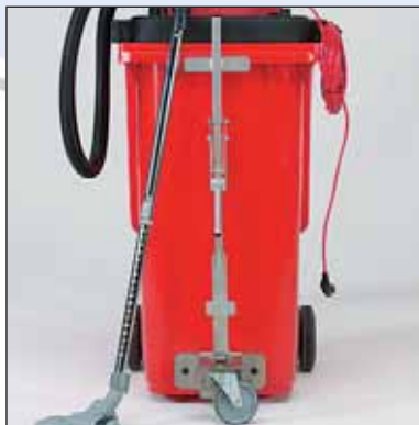
Também disponível para contentores com elevador e/ou com 3º roda!