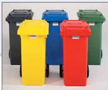
corpo e tampa em 5 cores

Oferecemos-lhe a mais vasta gama de contentores de 2 rodas: