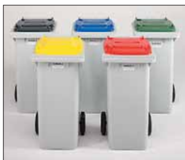
corpos em cinza claro com tampas coloridas

Será um prazer personalizar os seus contentores: