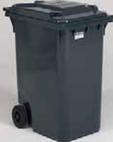
art.nº.: MGB 360 pegas