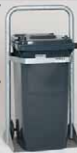
art.nº.: MGB 19 p/ 240 l

segurança p/ contentor abertura com chave trian- gular, volume de deposição limitado