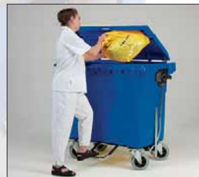
pedal para trabalhos pesados