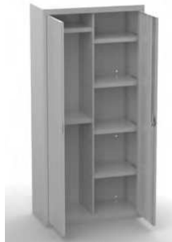
MOD. ARM06 COD. 19006