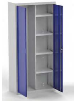
MOD. ARM02 COD. 19002