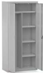
MOD. ARM08 COD. 19008