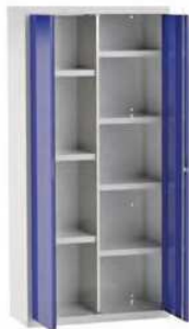
MOD. ARM07 COD. 19007