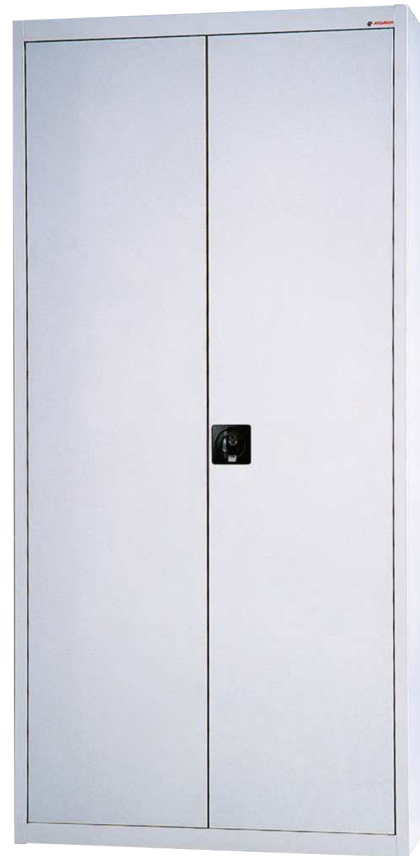
MOD. ARM01 COD. 19001