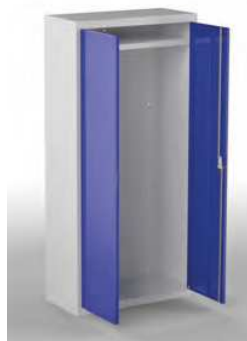
MOD. ARM09 COD. 19009