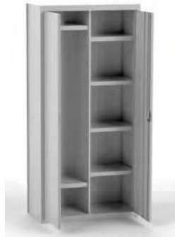
MOD. ARM04 COD. 19004