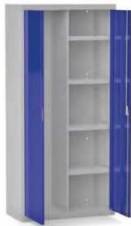
MOD. ARM03 COD. 19003